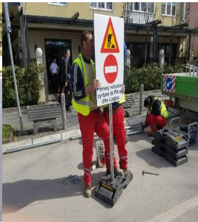
Furnizimi dhe vendosja e shtyllave antiparking për lirim të hapësirave publike, rregullimi dhe mirëmbajtja e shenjave të komunikacionit.