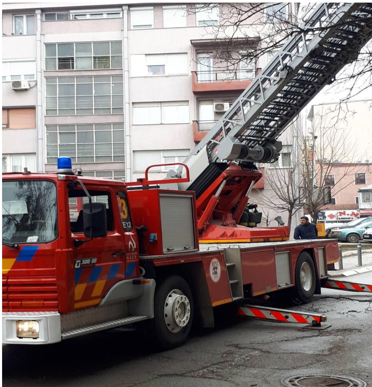
Intervenimet nga BPZ-ja dhe ekipet emergjente;