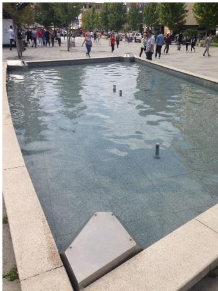
Mirëmbajtja e fontanave dhe krojeve.