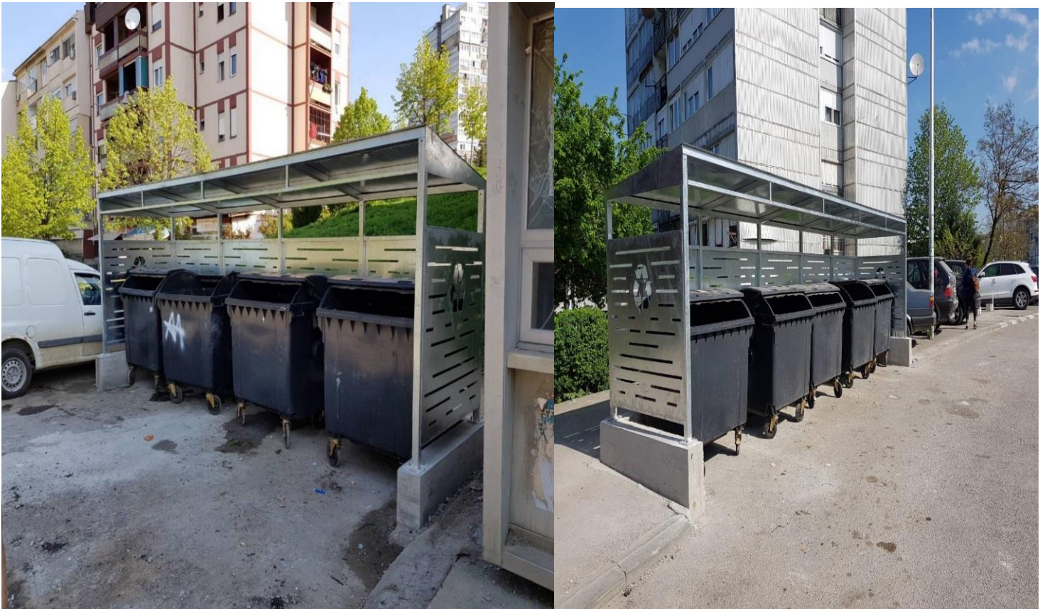
Mirëmbajtja dhe pastrimi i mbeturinave në qytet dhe hapësira publike.