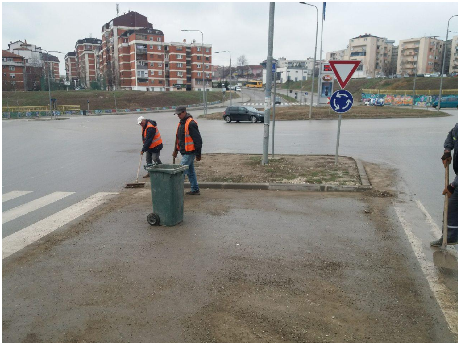
Mirëmbajtja e rrugëve dhe trotuareve në qytet.