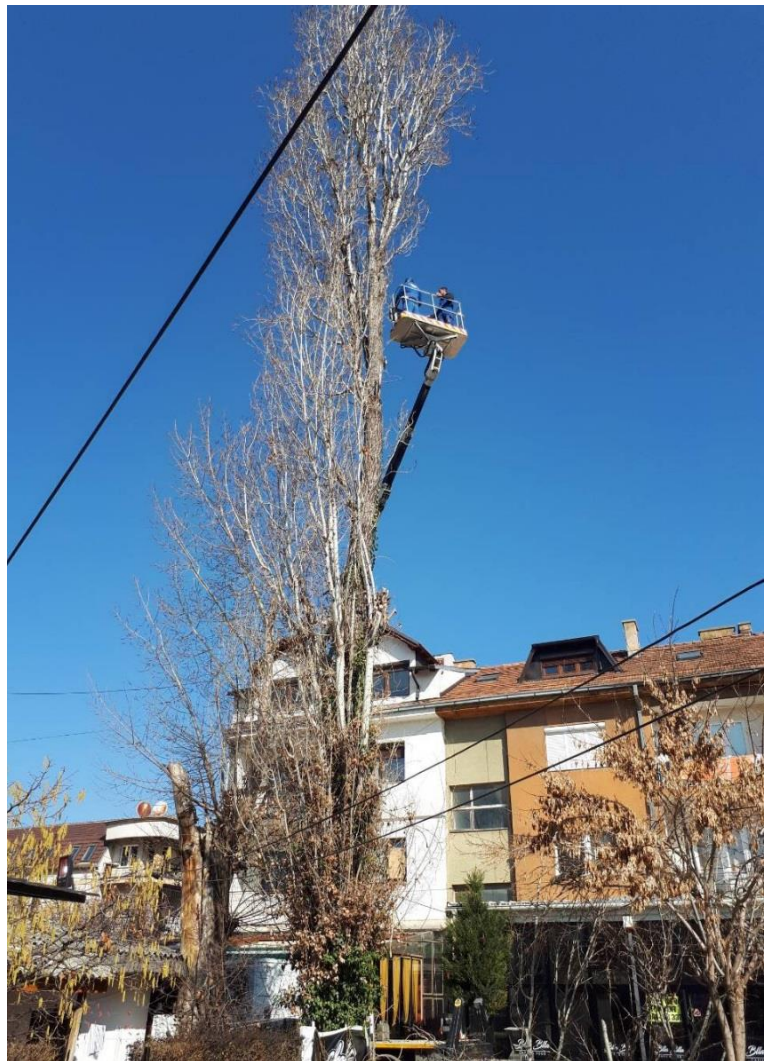
Prerja e drurëve, parandalimi nga fatkeqësitë natyrore dhe fatkeqësitë tjera.