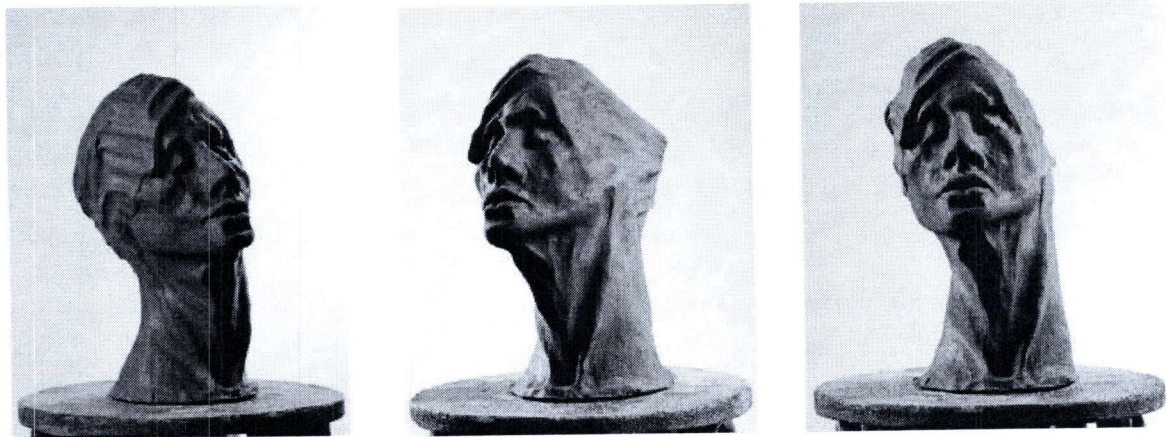
Skica e skulpturës sipas kërkesës së Drejtorisë së Kulturës