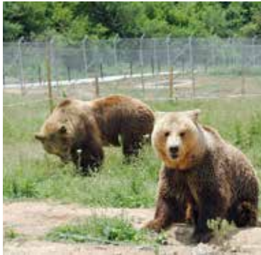
Pylli i Arinjve në Badovs, 15 kilometra nga Prishtina.