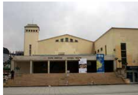
Ndërtesa e Teatrit Kombëtar të Kosovës.

Në fillim me emrin Teatri Popullor Rajonal e pastaj Teatri Popullor Krahinor u themelua me vendim të Kuvendit të ish-Krahinës Socialiste Autonome të Kosovës në tetor të vitit