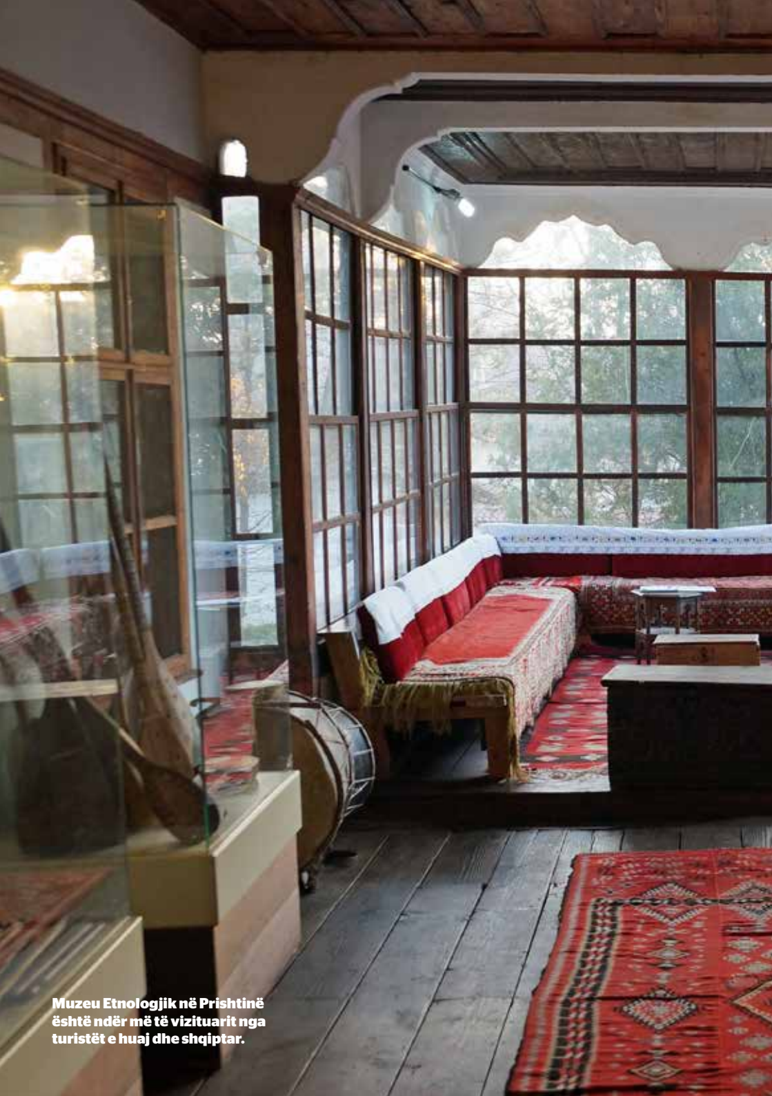
Muzeu Etnologjik në Prishtinë është ndër më të vizituarit nga turistët e huaj dhe shqiptar.