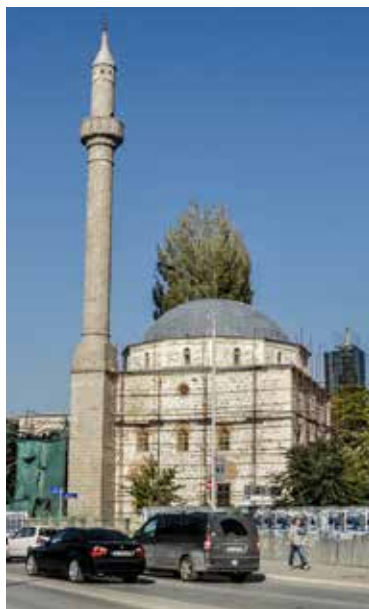
Ndërtesa më e vjetër në Prishtinë. Viti kur ka nisur të ndërsohet besohet se është 1382.

Xhamia e Çarshisë, njëherazi ndërtesa më e vjetër që ekziston sot në Prishtinë, shënon fillimin e qendrës së qytetit të vjetër. Në të kaluarën kjo xhami ndodhej përballë çarshisë së mbuluar që dikur kishte Prishtina. Menjëherë pas Betejës së Kosovës më 1389, Jil-dirim Bajaziti në emër të fitores së ushtrisë turke, e vuri gurthemelin e kësaj xhamie, ndërsa punimet përfundimtare i ndërmori Sulltan Mehmeti II Fatihu. Qytetarët i referoreshin kësaj xhamie edhe me emra të tjerë