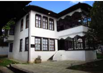
Kompleksi Emin Gjiku.

save të tjera fetare. Në të kaluarën, dhjetëra shatërvanë të ngjashëm publikë kanë qenë të shpërndarë nëpër qytet. Besimtarët myslimanë kanë përdorë shatërvanin për abdes, kurse një pjesë e qytetarëve të Prishtinës e kanë përdorur për ujë të pijshëm. Uji në këtë shatërvan para një dekade e më shumë ka ardhur nga burimet e Gërmisë, me gypa nëntokësorë. Shatërvani sot furnizohet me ujë të ujësjellësit të qytetit të Prishtinës. Uji rrjedh nga shatërvani në pllakë të betonit, e cila është e rrethuar me 6 pllaka të mermerit me lartësi 77 cm dhe gjerësi 80 cm. Pllakat janë të dekoruara me rozeta dhe dekore të tjera. Shatërvani ka ruajtur vetëm një pjesë të autenticitetit të tij. Në secilën pllakë të mermerit vërehen vrima në mes, të cilat tregojnë se në të kaluarën shatërvani ka pasur zhvillim më të gjerë, mirëpo ngritja e nivelit të rrugës ka mbuluar pjesë të tjera të tij.