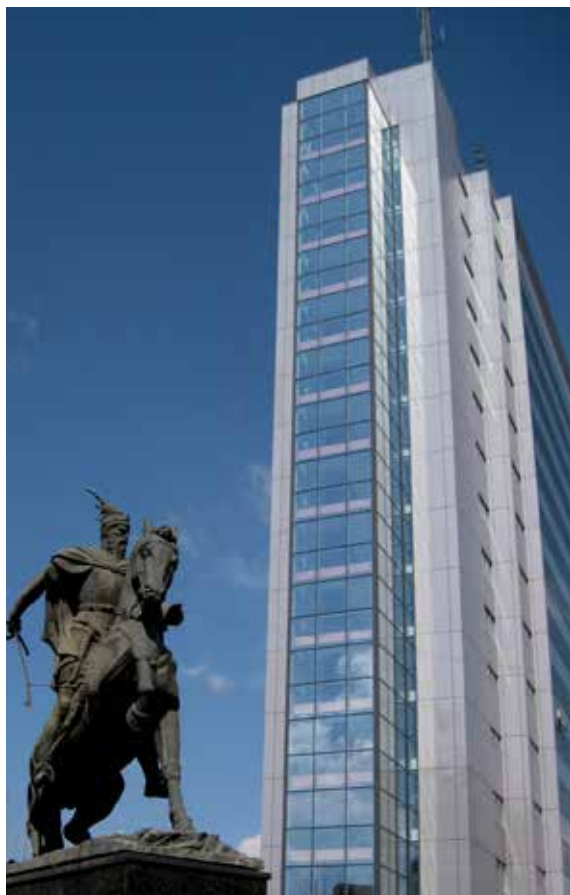
Ndërtesa e Qeverisë, dikur Banka e Kosovës.

Në kushte të sistemit paralel të organizimit, shqiptarët u detyruar të shpallin Republikën e Kosovës si shtet të pavarur, të njohur vetëm nga Shqipëria. Ky entitet politik e organizonte qeverisjen përmes qeverisë në ekzil, me një taksë 3% të mbledhur nga diaspora dhe gjithë qytetarët që gjenin disi punë. Livadhet dhe ambientet e improvizuara përdorehin për ligat paralele të sporteve, ndërkohë që kafeteritë e kishin rolin kryesor të ambi-