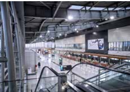
Terminali i ri i Aeroportit të Prishtinës është ndërtuar në vitin 2009.

e kohës. Përderisa në fillim programi thirrte për të drejtën për vetëvendosje, në vitet '80, kërkesa kryesore ishte Kosova Republikë dhe thirrje kundër shtypjes dhe diskriminimit jugosllav e pastaj serb ndaj shqiptarëve. Vepriktaria e lilegales, përveç organizimit të demonstratave, nënkuptonte shkruarjen e parullave, përgatitjen e fletushkave me artikuj informues e emancipues kombëtarë. Në qytetin e Prishtinës, ato shpërndareshin nëpër rrugë e rrugica. Policia kishte vënë në shënjestër aktivistët politikë të këtyre grupeve, të cilët ishin nën vëzhgim dhe ndiqeshin. Ish-anëtarë të lilegales dhe ish-të burgosur politikë, tregojnë që ikja prej policisë nganjëherë ka ndodhur duke kaluar mbi kulmet e shtëpive apo deriçkat e oborreve në pjesën e vjetër të qytetit, por edhe dukeu fshehur në varrezat e qytetit.