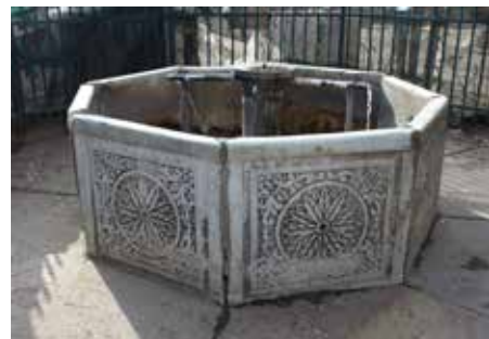
Shatërvani i qytetit daton nga shekulli XV.

Shatërvani i qytetit gjendet në kompleksin e Prishtinës së vjetër, konkretisht në oborrin e Xhamisë së Çarshisë. Ky shatërvan i dekoruar nga mermeri paraqet objektin e vetëm publik të llojit të këtillë në Prishtinë që ka mbijetuar deri më sot. Në bazë të llojit të ndërtimit dhe dekorimit prej mermeri, mund të thuhet se shatërvani është ndërtuar në fund të shekullit XVII ose fillim të shekullit XVIII. Zakonet kanë kushtëzuar që arkitektura islame të ndërtonte shatërvanë në qendër të hapësirave publike, afër ndërte-