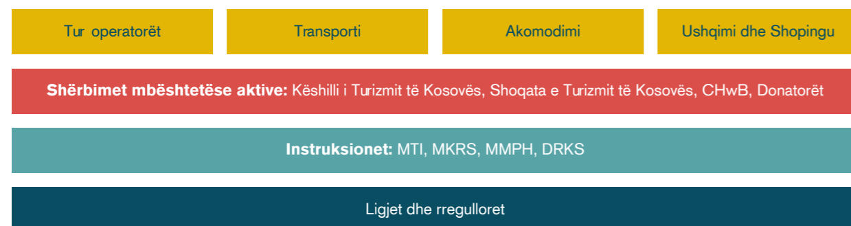
Figura 4: Akterët dhe funksionet relevante të turizmit

Ky seksion bën një përshkrim të shkurtër të akterëve dhe funksioneve kryesore në industrinë e turizmit në Prishtinë në një rën anë, si dhe njëkohësisht hedhë dritë mbi akterët mbështetës aktiv dhe ambientin mundësues/rregullues. Figura 4 paraqet në formë ilustrative relievin e përgjithshëm.